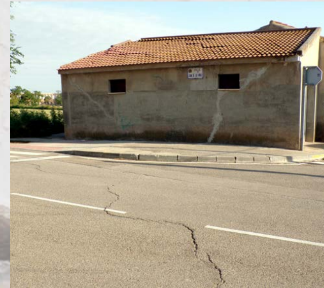
Zaragoza Octubre 2016/Diciembre 2016

Tema monográfico: "Investigación integrada de patologías constructivas en entornos urbanos."